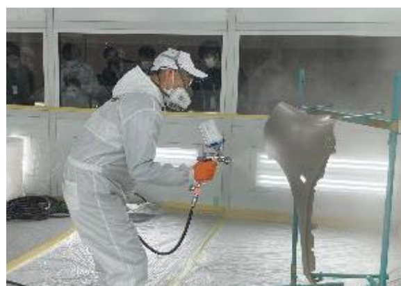
■塗装実演コーナー（実演塗装）